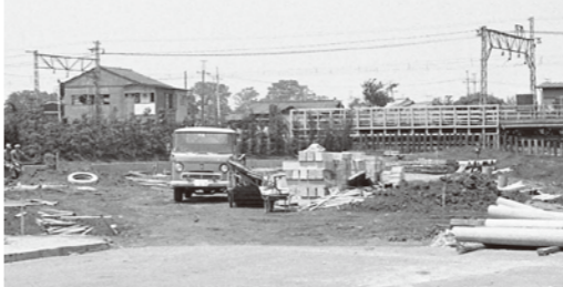
建設中の狛江駅南口ロータリー。奥が狛江駅ホーム(写真左・昭和44年)と、買い物客でにぎわう和泉多摩川商店街(45年)

◆昭和44年に狛江駅南口に清水川と沼を埋めて狛江駅南口通りとロータリーが造られました。バスも通るようになり、銀行が開設されたり、商店が少しずつ開店しました。それ以前は畑が多く、沼にはコイやカエルがいて釣りをしたり、いかだを作って遊びました。