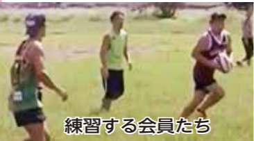
練習する会員たち

同クラブは、毎週土曜日の午前9時30分から多摩川河川敷など確保できたスペースで、大学生から60代までの会員がパスなどの基礎やサインプレーなどに加え、約1時間紅白戦をしている。ラグビー経験者も多いが、初心者にもルールや基礎技術もてい